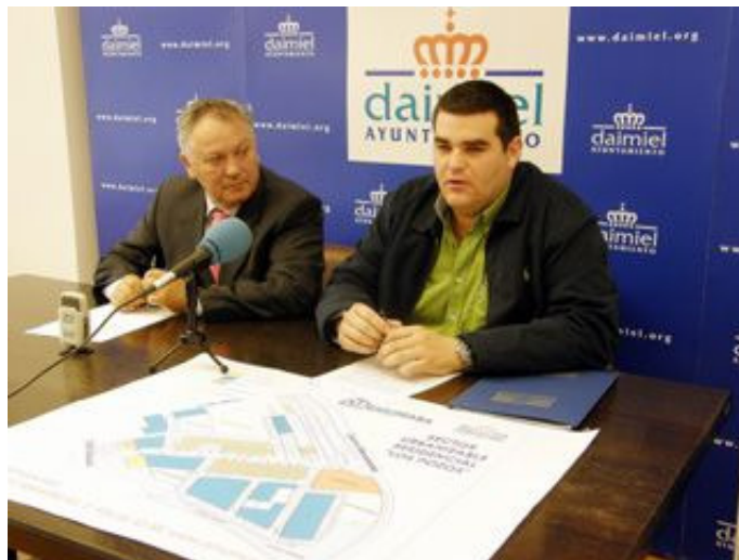
El alcalde (i) muestra a los medios los planos de la zona urbanizable en Los Pozos, acompañado del gerente de Emumasa.

De igual modo, a través de la empresa pública se ha instalado 56 contenedores soterrados, construcción de punto limpio, promoción de una planta de valoración de Residuos de la Construcción y Demolición; además de otros dotacionales como la gestión y explotación del parking municipal, construcción del Museo Comarcal, rehabilitación del mercado de abastos, adecuación de las oficinas de la Policía Local, remodelación de la Casa