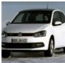
El nuevo VW Polo GTI, ya a la venta