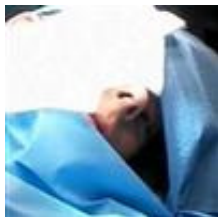
Cirugía plástica para los niños en Polonia