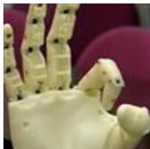
Mano robótica que puede interactuar a través de la red