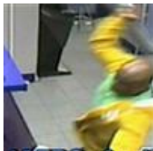
El héroe de un atraco a una casa de apuestas